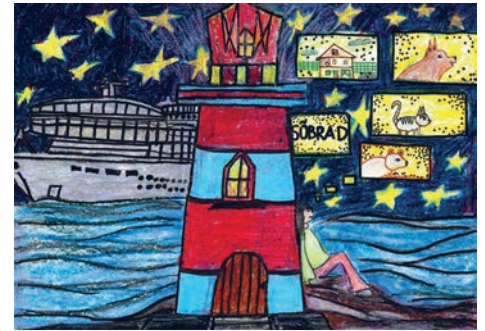
„Minu olulised majakad“, 3. kl