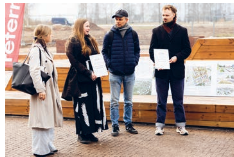
Võidutöö „Polügon“ autorid Laviin Arhitektid OÜ ja Skepast&Puhkim OÜ arhitektid.

„Polügoni visioon toetab Tartu ja Tartumaa rahvusvahelistumist ning loob eeldused Tartu linnalise piirkonna tugevamaks arenguks teatud vastukaaluna Tallinna regioonile, toetades sellega koostatava üleriigilise planeeringu eesmärke. Võidutööl on ka kõige suurem potentsiaal edasiseks arenguks