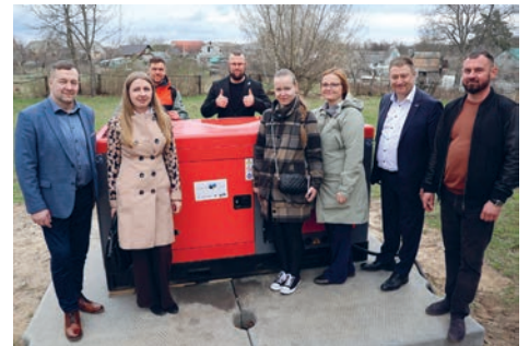
Tartu valla delegatsioon Vasõlkivi linnas.

Visiidi käigus osaleti heategevuslikul kontserdil kohalikus kultuurimajas, kus esinesid lapsed ja noored. Ürituse raames toimus oksjon ning ise valmis-