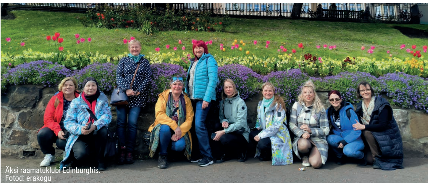
Äksi raamatuklubi Edinburghis.

Kindlasti küsite, kas Glasgow oli siis parem kui Edinburgh. Aga eks minge ja otsustage ise!