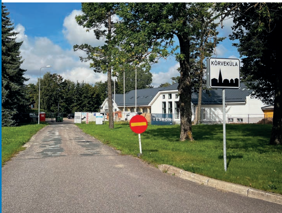
Foto on tehtud septembris, kui remont veel käis.

Kauaoodatud remondi tulemusel sai vallamaja kaasaegsed tehnosüsteemid. Uuendati kütte- ja elektrisüsteemi ning rajati seni vallamajas puudunud ventilatsioon ja jahutus. Värske ilme sai ka vallamaja saal ja fuajee interjäär.