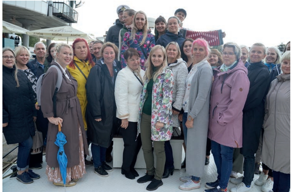
Tänuüritusel osalenud kollektiivide esindajad.