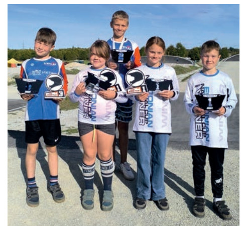
Estonian BMX Open CUP 2024 karikasarja, Foto: Kadri Tani

Suur tänu nii klubidele, treeneritele kui ka vanematele, kes kõik panustavad vastavalt võimalustele ja natuke rohkem.