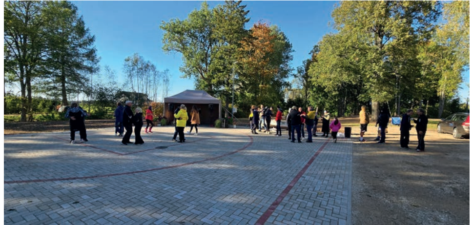
Tammistu tantsu- ja korvpalliplatsi avamine.