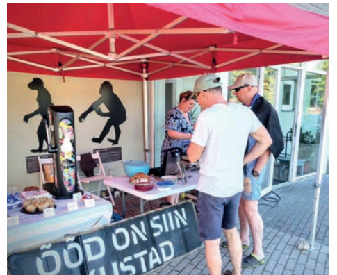
Kogukonnakohvik Õõd on siin mustad.

Muuseumiööl osales ka Jääaja Keskus, MTÜ Äksi aleviku kogukond pakkus head ja paremat kodukohvikus „Õõd on siin mustad“ ja Järve pood oli tavapäraselt kauem avatud. „Sel aastal osa-