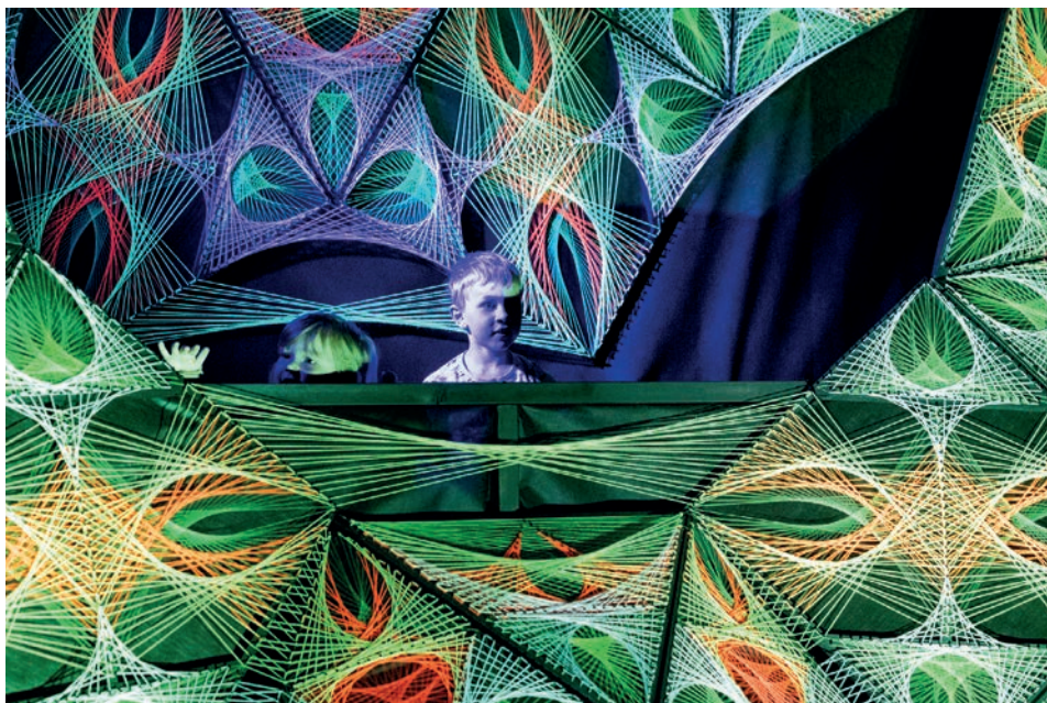
Fotol vaade nöörikuunsti näitusele „Elu läbi maatriksi“, mis oli avatud ERMi osalussaalil kui eelmise konkursi võiduidee. Autor: Anu Ansu.

2. mail avatakse osalussaalil eelmise aasta konkursi võidunäitus „Kummalised kohtumised“. Näitus keskendub