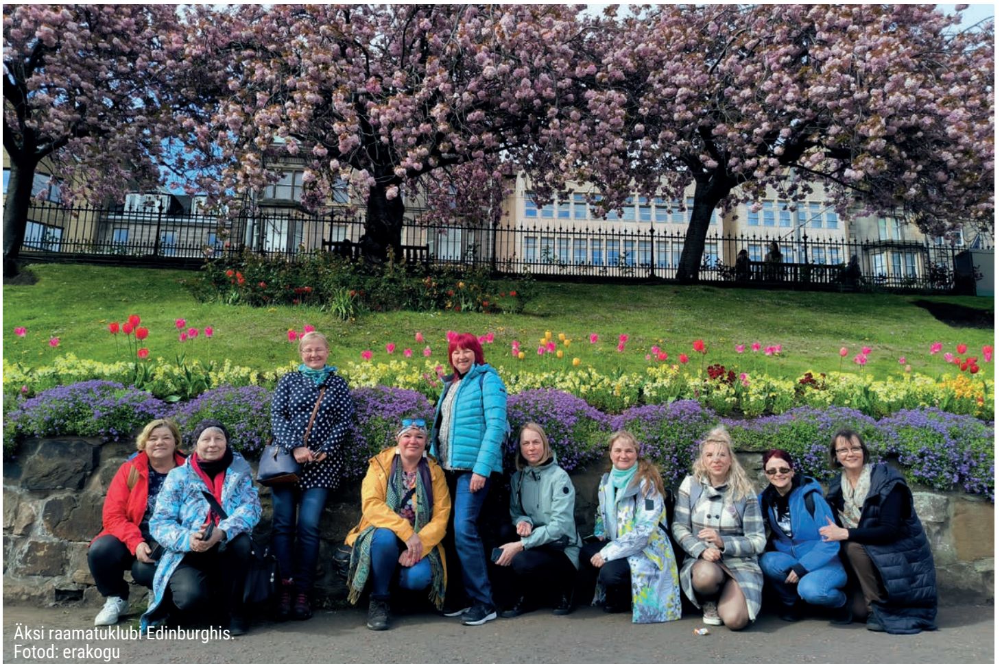
Äksi raamatuklubi Edinburghis.

Linna olulisimaks vaatamisväärsuseks on Edinburghi kindlusloss, mis kõrgub järskude seintega kaljurünkal (Castle Rock). Ei saanud meiega seda linna vanimate (loss on kaljul asunud 11.saj alates) ja suurejoonelisemate ehitiste hulka kuuluvat kompleksi jätta külastamata, pealegi annab lossis asuv muuseum hea ülevaate Šotimaa kuninglikust ajaloost ning eluolust. Loss on mänginud Šoti ajaloos silmapaistvat rolli – olnud kuninglik elukoht, arsenal, rahvusarhiiv, rahapada, vangla, sõjaväekindlus ja Šotimaa regaalide kodu. Siin ühes tillukeses toas sünnitas Mary Stuart tulevase Šotimaa ja Inglismaa kuninga James I. Kuninga lahkumisel Inglismaale peideti Šoti kuninglikud regaalid mitmeks