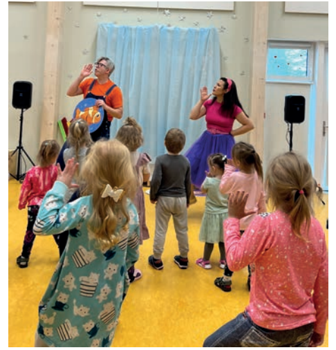
Nädala oodatuum sündmus oli Lolala muusikamaa kontsert.

Iga muusikanädala päev oli omanäoline ning andis kogu Muumiperlele uusi teadmisi ja põnevaid elamusi erinevate kultuuride muusikast.