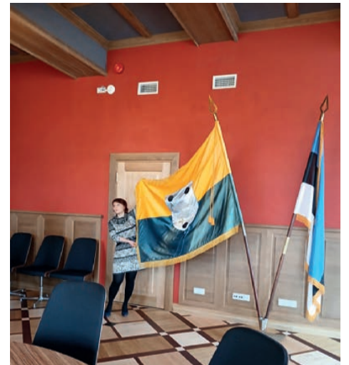
Lähte kogukond Narva linnapea kabinetis.