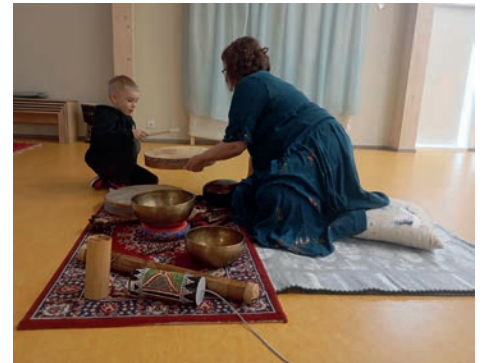
Muusikanädal algas erinevate kultuuride pillide tutvustusega.