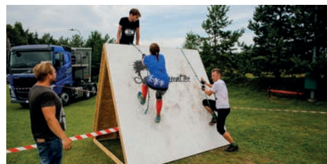
Vägilase jooks Lähel 2015.a

tagasisidet ja mõtteid. Ma usun, et meil on kümne aastaga olnud päris metsik areng nii korralduslikult kui ka takistuste osas, aga alati saab ju veel vingemalt ja paremini teha!“ räägib Anton. Korraldamine on kahtlemata väsitav ja stressirohke, kuid isegi see ei heiduta Arvit.