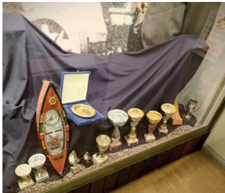
Näitus „Töö tänab tegijat“ Soomepoiste tuba-muuseumis.

Muuseumiööl tutvustasimegi külastajaile Äksi inimeste paljude aastakümnete jooksul saadud autasude kirevat kollektsiooni. Näitusel jätkus uudistamist nii nooremale kui ka vanemale külastajale. Selleks, et näitus ikka tõeliselt võimas tuleks, kontrollisid mitukümmend äksikat eelnevalt üle oma kapid ja sahtlid, varakirstud ja lakapealsed!