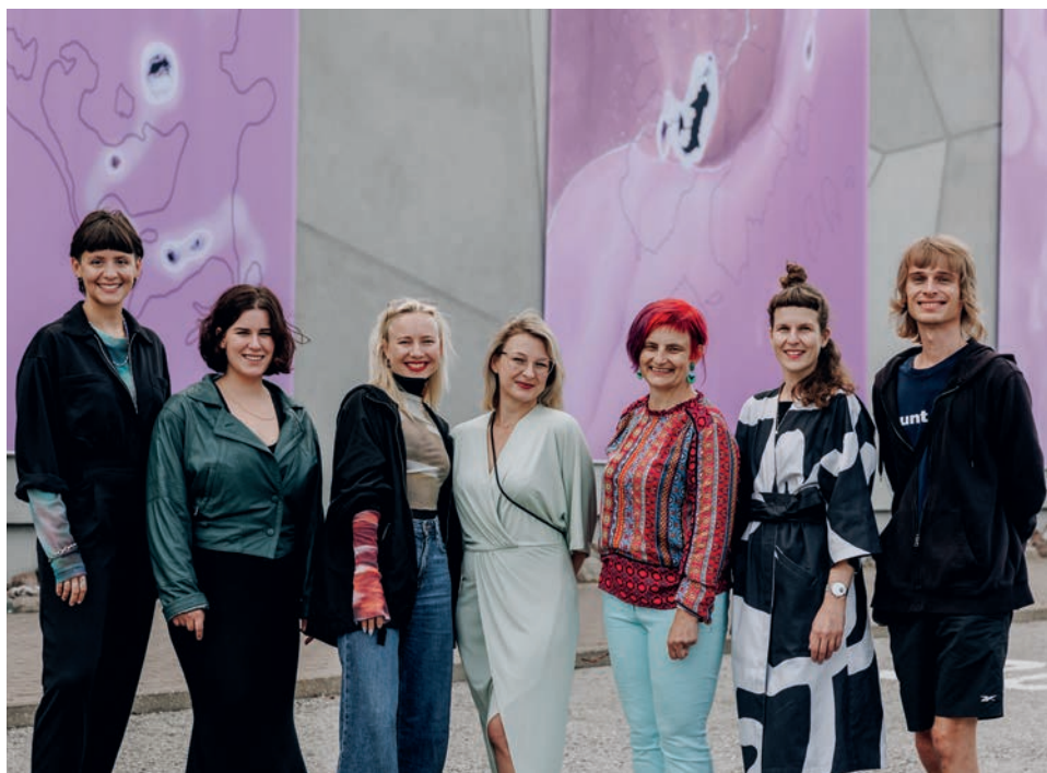
„Look into my ice“ avamine.

Ka tutvustati kultuuripealinna raames Tartu vallas toimuvaid teisi projekte – „Linnast välja“ ja Äksi eelarvamusfestivali.