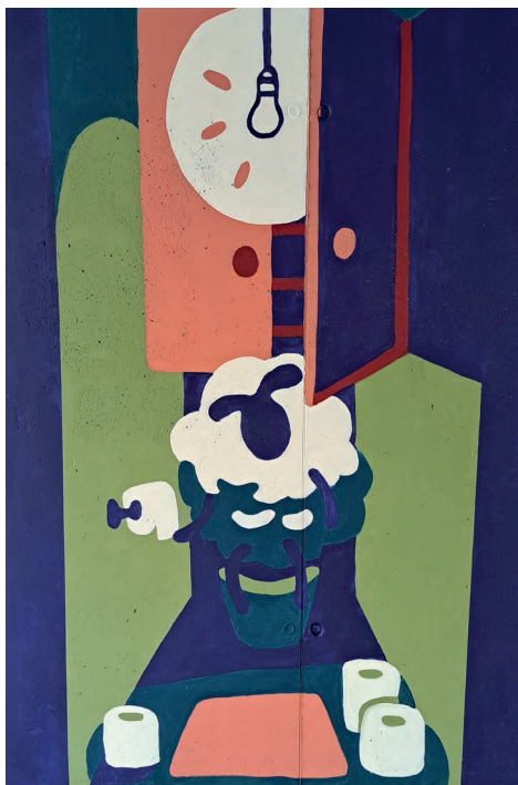
Elutoas on keskse koha sisse võtnud lammas.

Järgmisel aastal kannab Tartu vald koos 19 Lõuna-Eesti omavalitsusega kultuuripealinna tiitlit. Tartu 2024 põhiprogrammi kuuluv projekt kunstifestival „Linnast välja“ on oma ettevalmistusega juba algust teinud – valminud on 2 seinamaali Tabivere ja Kõrveküla käigutunnelitesse.