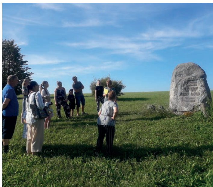
Äksi nõia mälestuskivi Puhtaleiva külas.