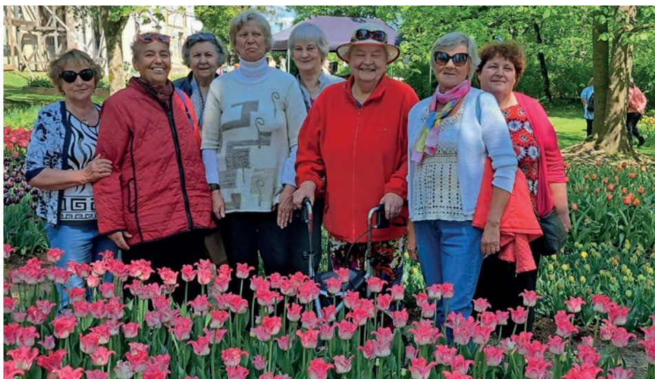
Antiikhõbe tulpe vaatamas.

Kuna eelnevalt oli kõik korralduslik pool Kirnaga kokku lepitud, siis saime nautida imelisi tulbivälju. Silma ees avanesid värvikirevad tulbitriibud, mis nagu voogavate värvilainetena naelutasid paigale seda looduse imelist kättetööd vaatlema ja nautima. Ilm oli võrratult soe ja päikesepaisteline. Uurisime ka Kirna mõisa pargis energetilisi tervendavaid pinke ja lasime hea energiaga oma keha ravida ja tohterdada ning talletasime ilusaid värve, helisid ja tundeid. Tutvusime imeliste ja maitsekalt üles riputatud tulbikompositsioonidega ning jalutasime taastatud mõisas ringi. Väike puhkehetk kohvi ja koogiga ja tagasisõit kodu poole võis alata. Järgmisel kevadel kohtume kindlasti uuesti.