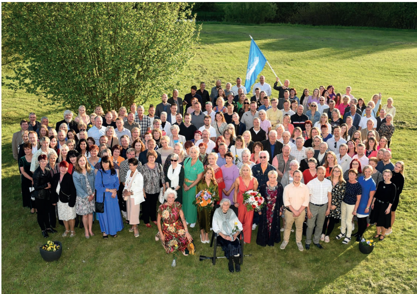
Tabivere kool 50.

Loodame, et see päev jätab kõigisse meisse sügava mulje ja paneb meid veelgi rohkem hindama meie kooli, kogukonda ja kõiki neid inimesi, kes on meid kujundanud ja toetanud meie teekonnal.