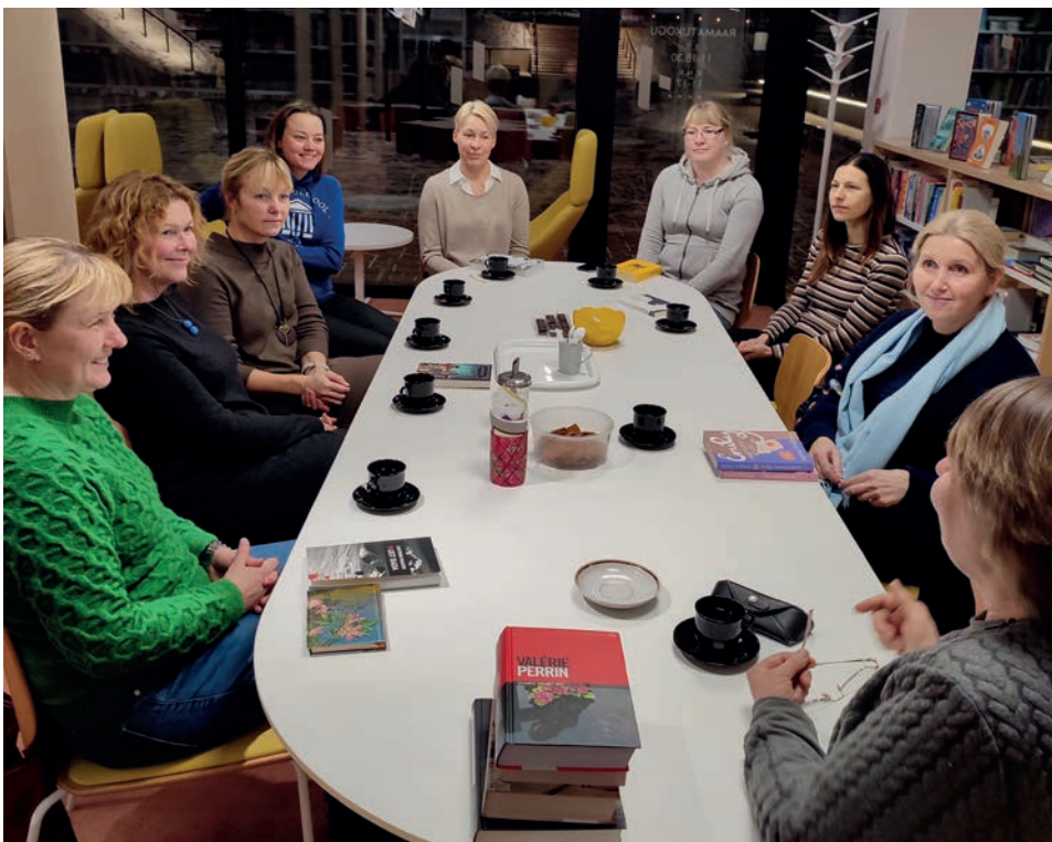
Raamatuklubi esimene kohtumine Jaanuaris.

Raamatuklubi iga kohtumine algas raamatukoguhoidja sissejuhatuses teemasse, kus ta avas laiemalt tausta raamatu autori või vastava teose kohta. Mõnel korral õnnestus vaadata teleekraanilt Ludmilla Ulitskajaga ja Jutta Kivimäega tehtud lõiku vestlustest varasemalt toimunud Prima Vistal ja ühte Andrus Kivirähkiga tehtud intervjuud,