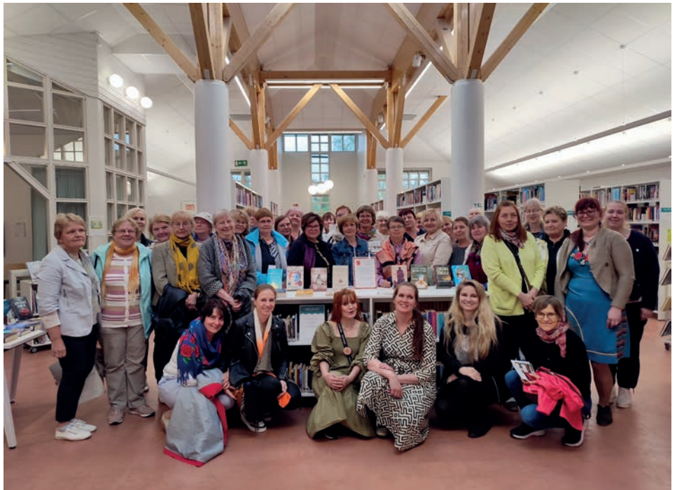
Tartumaa raamatukogutöötajate õppereis Soome.

Lotta Svärdi tegevus oli nii muljetavaldav, et organisatsioon saadeti 1944. aastal vastavalt Moskva vaherahule kokkuleppele laiali. Pärast likvideerimist kadus Lotta Svärd Soome ametlikust