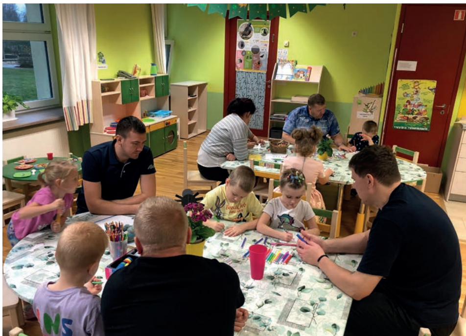
Meisterdamine koos isadega.

Tartu valla esimene tasandusrühm avati Kõrveküla lasteaias Päikeseratas 2019. aasta augustis. Esimesel õppeaastal alustas Konnapoegade rühmas 12 vahvat poissi vanuses 3 kuni 7 (üks neist oli koolipikendusel). Igal kevadel on läinud kooli vähemalt kaks last, esimesel õppeaastal lausa neli poissi. Aasta-aastalt on tüdrukute osakaal järjest suurenenud ja käesoleval õppeaastal on meil rühmas 6 tüdrukut.