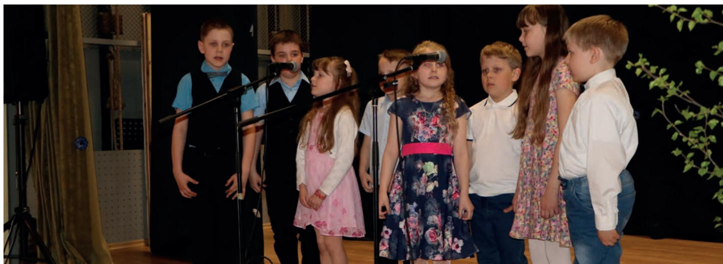
Emadepäeva ja kevadkontsert.