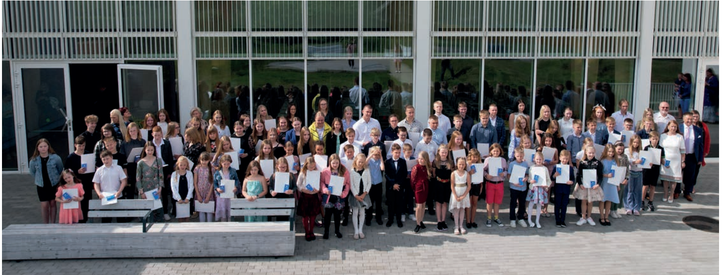
Vallavanema vastuvõtt parimatele õpilastele Tabivere Põhikoolis.

lavanem Jarno Laur tänas ja tunnustas tublisid õpilasi. Tunnustustseremoniale järgnes mustkunstnik Kevinski meeleolukas etteaste. Seejärel tehti ühispilet ja söödi pidukooki.