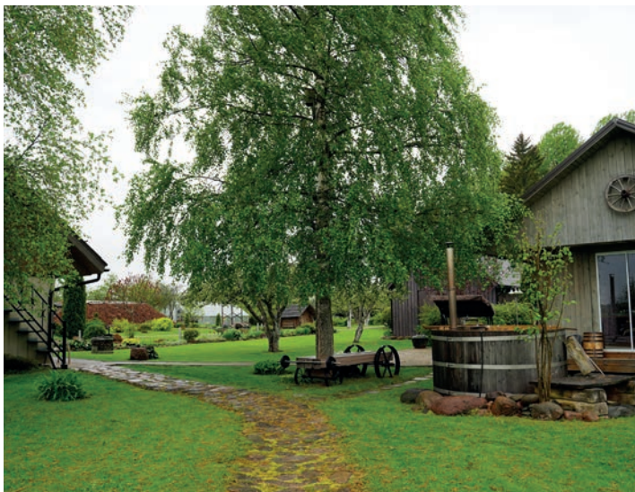
Nõela külas asuv Rundo kinnistu otsustati esitada „Tartumaa kaunis kodu 2023“ kandidaadiks.