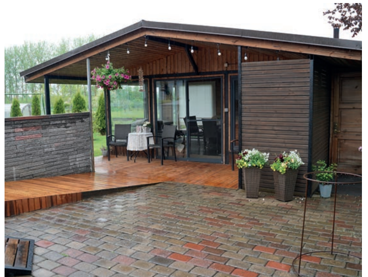
Tabivere alevikus asuv Hariduse tn 3 kinnistu esitati riigihalduse ministri tänukirja ning mastivimpli kandidaadiks.