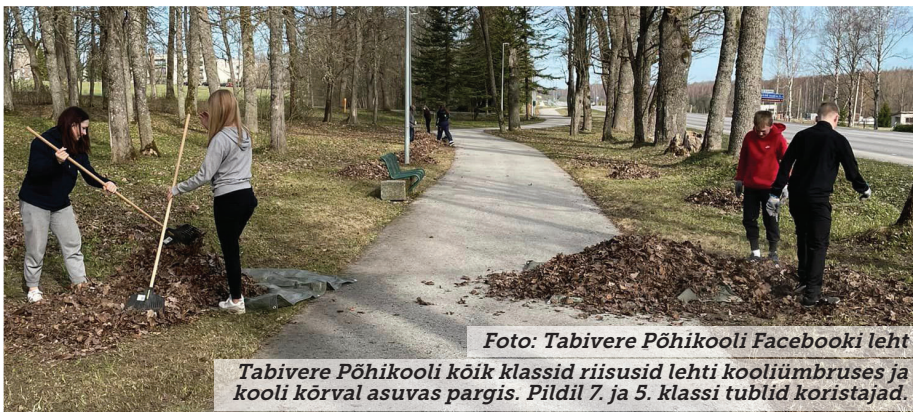
Tabivere Põhikooli kõik klassid riisusid lehti kooliümbruses ja kooli kõrval asuvas pargis. Pildil 7. ja 5. klassi tublid koristajad.