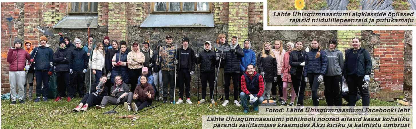
Lähte Ühisgümnaasiumi põhikooli noored aitasid kaasa kohaliku pärandi säilitamise kraamides Äksi kiriku ja kalmistu ümbrust