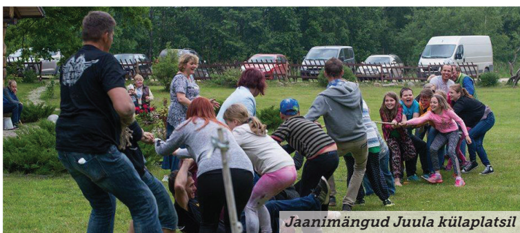
Jaanimängud Juula külaplatsil