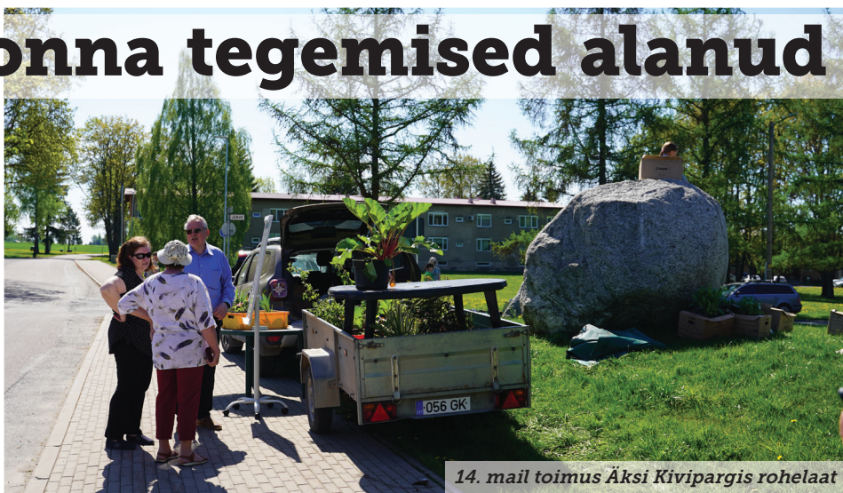
14. mail toimus Äksi Kivipargis rohealaat