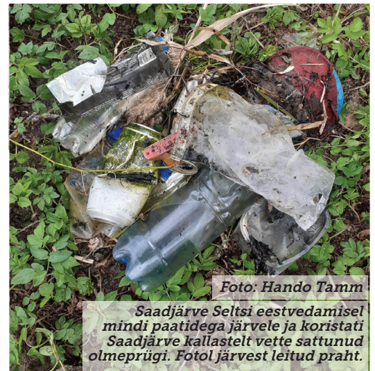
Saadjärve Seltsi eestvedamisel mindi paatidega järvele ja koristati Saadjärve kallastelt vette sattunud olmeprügi. Fotol järvest leitud praht.