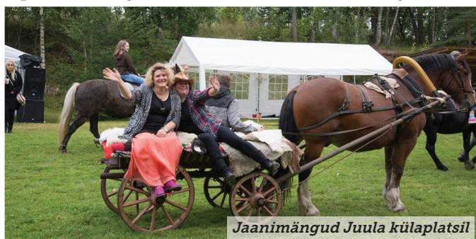
Jaanimängud Juula külaplatsil