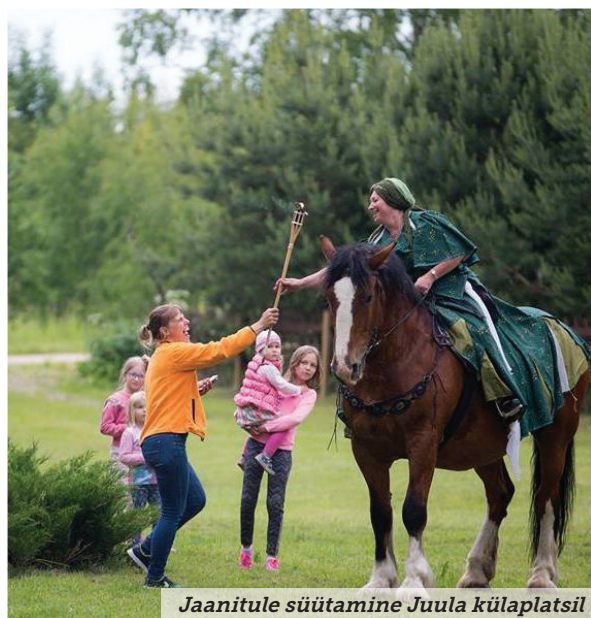
Jaanitule süütamine Juula külaplatsil

Rohkem infot sauna ja MTÜ Juula Jõhvikas kohta leiad veebileheküljelt www.juula.ee .