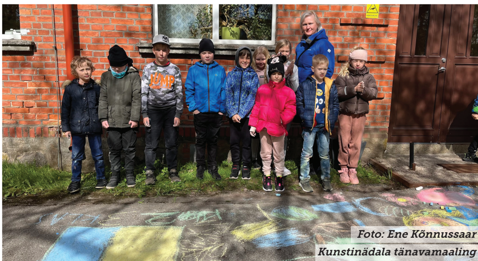
Kunstinäda tänavamaaling