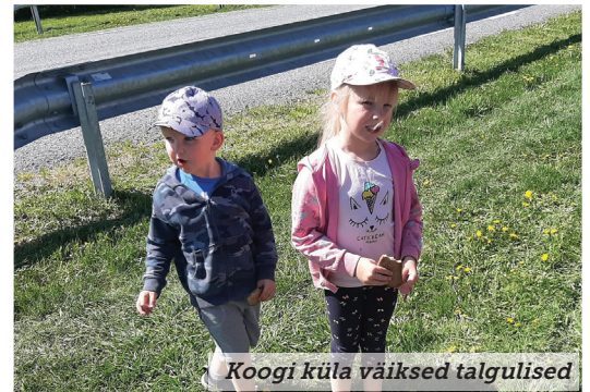
Koogi küla väiksed talgulised