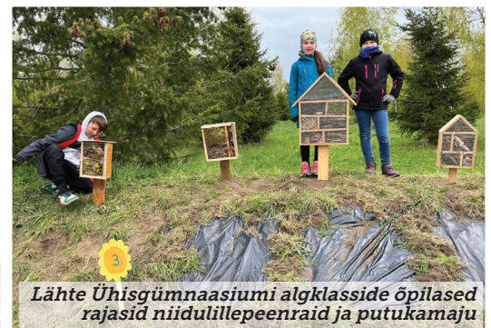
Lähte Ühisgümnaasiumi algklasside õpilased rajasid niidulillepeenraid ja putukamaju