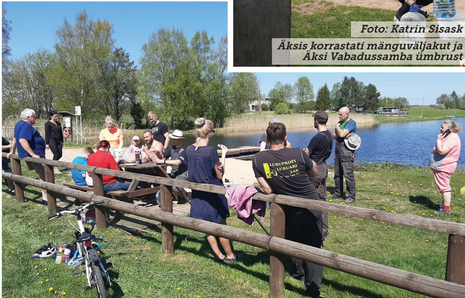
Fotod: Liia Koortsi postitus Koogi küla Facebooki lehel Koogi külas uuendati rannaala purret, laste ronilat, istumiskohti jms. Remonditi ja värviti bussipeatust ja kuulutustetulp. Kortermajad koristasid aga keldreid