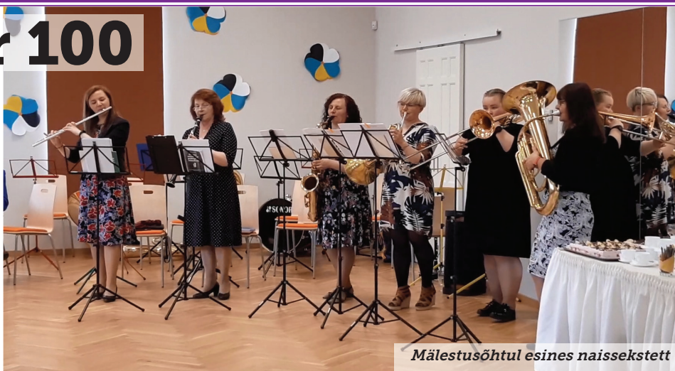
Mälestusõhtul esines naissektett