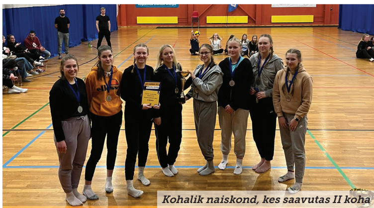
Kohalik naiskond, kes saavutas II koha

Osales 8 meeskonda ja 6 naiskonda. Kokku 42 naist ja 69 meest. Naiste arvestuses võitis Põltsamaa VK, II koha sai Lähte/Tartu VSK ja III koha sai Iisaku naiskond. Meeste arvestuses võitis Luunja, II koha sai Mustvee ja III koha Repsna. Soomest osales Roni Penttilä eestvedamisel ka meeskond Exclusive Logistics Finland.