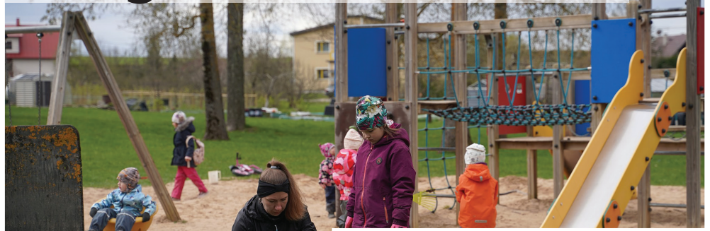
Äksis korrastati mänguväljakut ja Äksi Vabadussamba ümbrust

Sel aastal toimus Teeme ära! Talgupäeva raames Tartu vallas rekordarv talgud. Meie koduvallas oli registreeritud 20 talgut. Kokku toimus sel aastal Teeme ära! raames 1233 talgut. Siin väike fotomeenusut vaid osadest toimunud talgudest.