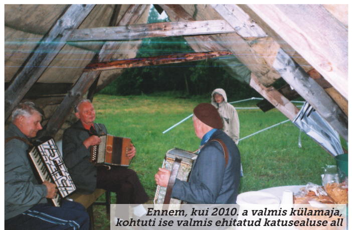
Ennem, kui 2010. a valmis külamaja, kohtuti ise valmis ehitatud katusealuse all