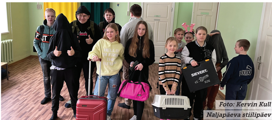
Naljapäeva stiilipäev