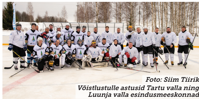
Võistlustulle astusid Tartu valla ning Luunja valla esindusmeeskonnad