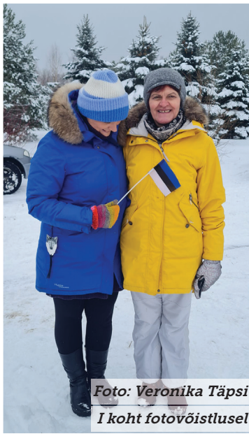
I koht fotovõistlusel

Tammistu Raamatukogu-Külakeskus korraldas aga taas traditsioonilise fotokonkursi mille rahvalemmikuteks