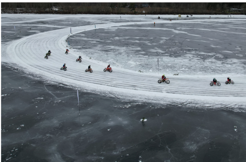
29. jaanuaril toimusid Kalda ranna jäärajal motokrossi EMV ja EKV teine etapp

Tekst ja foto: Katrin Sisask, Tartu valla Kuukirja toimetaja