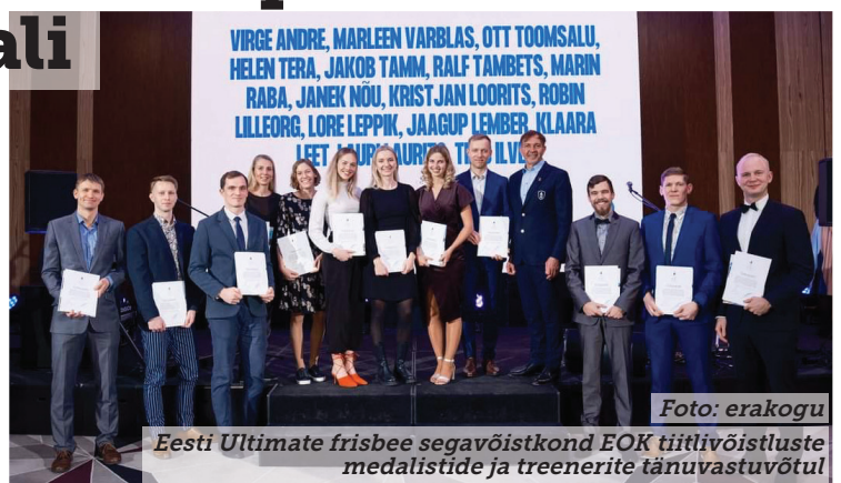
Eesti Ultimate frisbee segavõistkond EOK tiitlivõistluste medalistide ja treenerite tänuvastuvõtul

harrastatakse discgolfist veidi erineva kettaga. Kuigi mänguvahendiks on palli asemel ketas, siis mängu dünaamika on pigem sarnane palliga mängitavatele spordialadele (jalgpall, ameerika jalgpall).