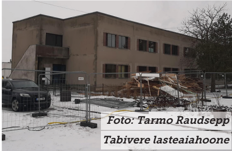
Tabivere lasteaiahoone

Tabivere Lasteaed Rõõmula katlamaja pooles tiivas ja saali ning köögi osas alustati veebruaris lammutustöödega. Tööd on graafikus ja alanud on trassitööd ning ehitustegevus. Töödega kaasnevaid ebamugavusi üritatakse hoida nii vähesena kui võimalik. Hoia end ehitustöödega kursis Tartu valla kodulehel olevas blogis www.tartuvald.ee/blogi/tabivere-lasteaed