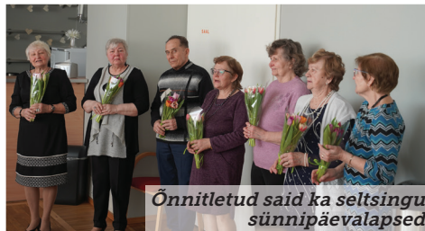
Õnnitletud said ka seltsingu sünnipäevalapsed