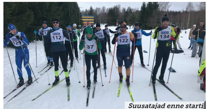
Suusatajad enne starti

Üldkokkuvõttes pärast teist etappi vahetus talimängude liider. Esikohtadega suusutamises ja uisutamises ning kolmanda kohaga laskmises asus võistlust juhtima spordikooli võistkond 155 punktiga ning jättis teisele kohale esimesel etapil liidrikohta hõivanud Tabivere Põhikooli võistkonna, edestades neid nüüd viie punktiga. Kolmanda koha säilitas Kastli küla võistkond, kes on nüüd kogunud seitsme alaga 140