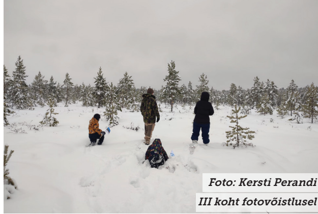
III koht fotovõistlusel