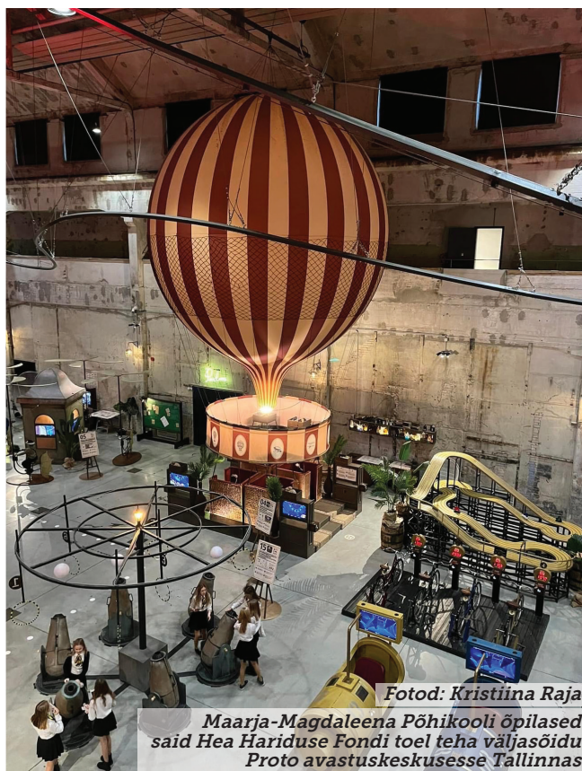
Maarja-Magdaleena Põhikooli õpilased said Hea Hariduse Fondi toel teha väljasõidu Proto avastuskeskusesse Tallinnas

Rohkem infot Hea Hariduse Fondi kohta leiad Tartu valla koduleheküljelt www.tartuvald.ee