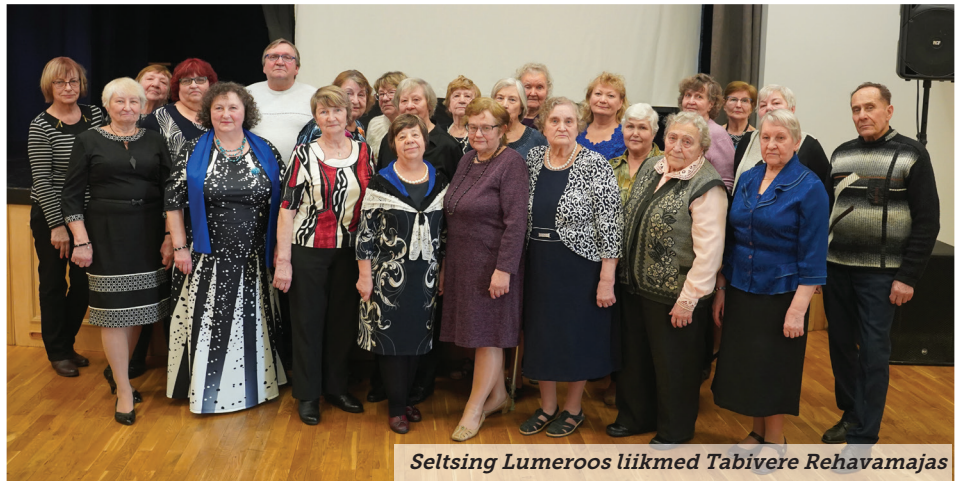
Seltsing Lumeroos liikmed Tabivere Rehavamajas