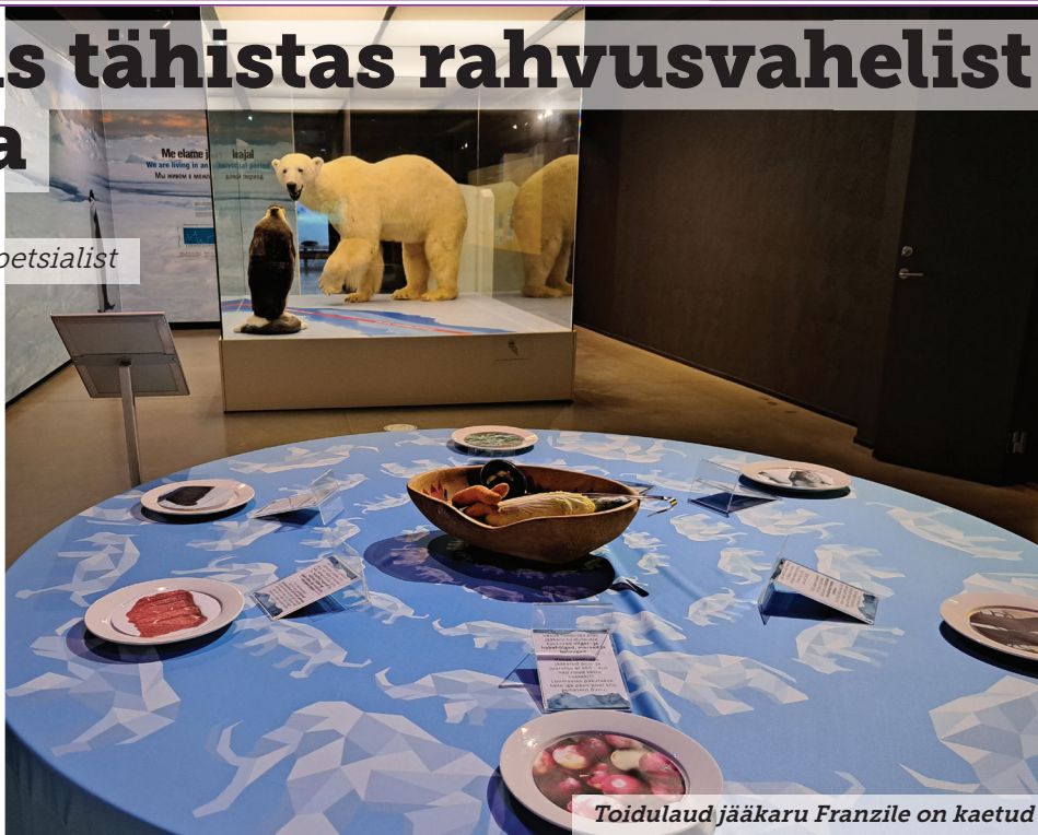
Toidulaud jääkaru Franzile on kaetud

Tallinna Loomaaia jääkarule antakse 3 korda nädalas 500 grammi Hiina kapsast. Ka vitsutab ta pea iga päev pool kilo porgandeid. Tallinna looma-